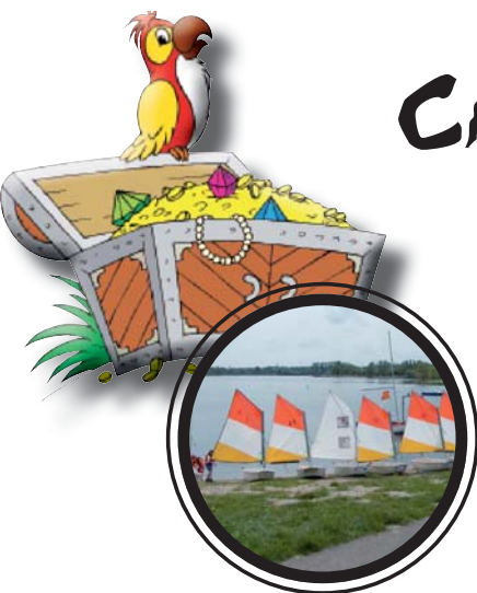
CRITÉRIUM 1 CN LA MUTCHE 3 MAI