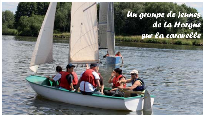
Un groupe de jeunes de La Horgne sur la caravelle