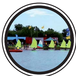
CRITÉRIUM 2 SN CAP250 17 MAI