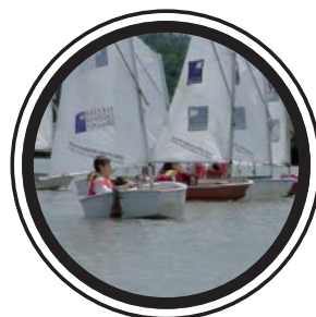
CRITÉRIUM 3 CN LORRAIN 24 MAI