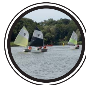
CRITÉRIUM 4 CN CREUTZWALD 14 JUIN