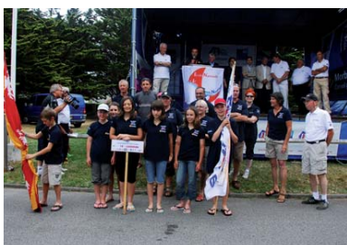
L'équipe de lorraine en opti.